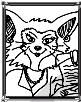
Felicia la zorra