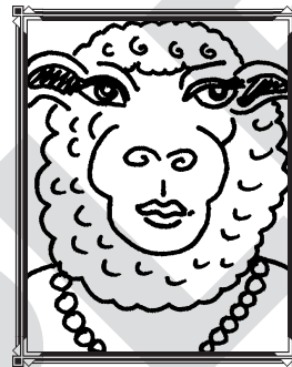
Ceci la oveja