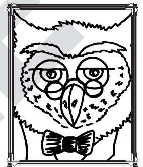
Osborne el búho