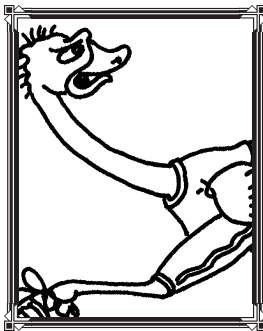
Oliver el avestruz