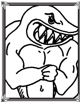
Samuel el tiburón

Ahora eres un nuevo empleado de "Caricaturas, S.A." Tu primera tarea es hacer una caricatura que muestre a todos los personajes que aparecen a continuación. Todos están envueltos en un conflicto. Tu trabajo es: Desarrollar la personalidad de cada personaje. ¿Cómo actúan generalmente éstos animales? ¿Qué es lo que se dicen unos a otros? ¿Cómo podrán manejar el conflicto entre todos?